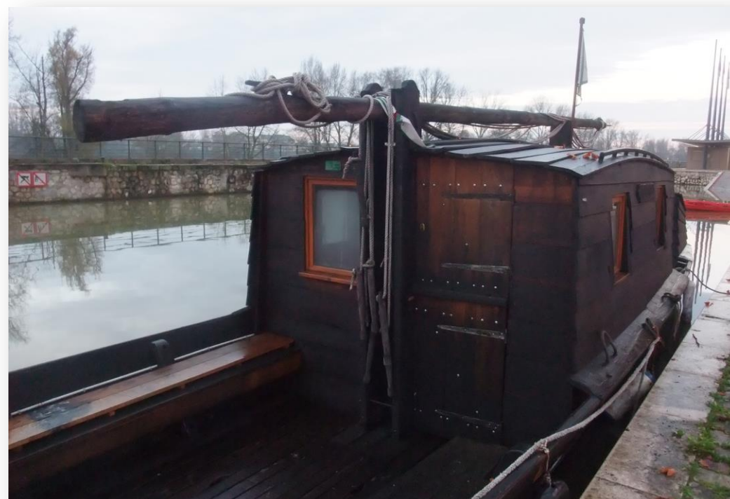
Chaland de Loire à Orléans en novembre 2014

Une volonté de renouveau face à une situation qui n'est pas sans rappeler celle des années 90, époque de la création de notre réseau. Nous avons tous besoin de votre concours, rejoignez-nous !